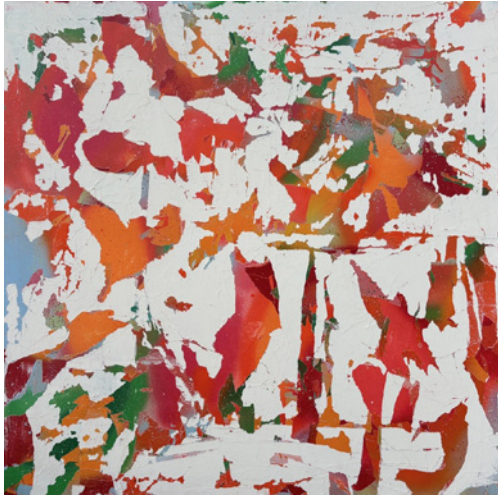
Araza - série Scrapes 105x105 cm