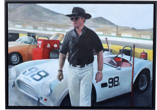
-Cobra- Shelby Oil on canvas - 70x50 cm